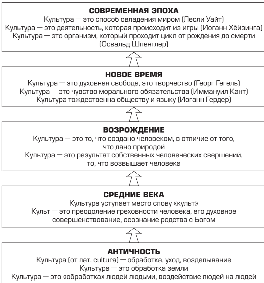
Рис. 1. Схема исторической эволюции понятия «культура»

Экскурс в историю эволюции термина «культура» показывает, что попытка его осмысления предпринималась на протяжении длительного периода времени. В 1952 г. в Америке вышло специальное исследование Альфреда Крёбера «Культура, критический обзор определений», где приведено около 150 определений культуры. Сегодня существует более 300 определений, но универсального нет, потому что это сложное явление общества и подходов к его изучению множество. Основные подходы — это философский, антропологический и социологический. Их сущность кратко изложена в таблице 1.