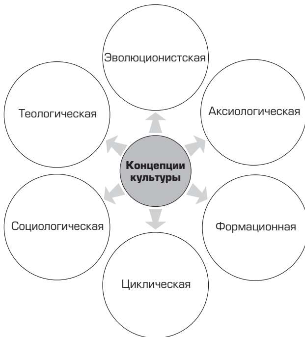
Рис. 4. Концепции прогрессивного развития культуры

Во второй половине XIX в., когда развиваются этнография, археология, антропология, социология, история, философия и многие другие отрасли знания о человеке, анализ феномена культуры начинает осуществляться в рамках научно-концептуальных направлений, в рамках концепции прогрессивного развития культуры , а именно: эволюционистской, аксиологической, антропологической, формационной, циклической, социологической и др. концепций культуры (рис. 4). Рассмотрим их.