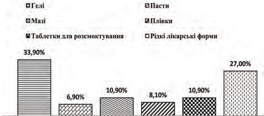
Рис. 1. Розподіл ЛП, що застосовують лікарі-стоматологи, за лікарськими формами

Головною метою даного блока анкети було визначення лікарських форм, які лікарі радять застосовувати при захворюваннях стоматологічного профілю. Результати опитування візуалізовані на рис. 1.