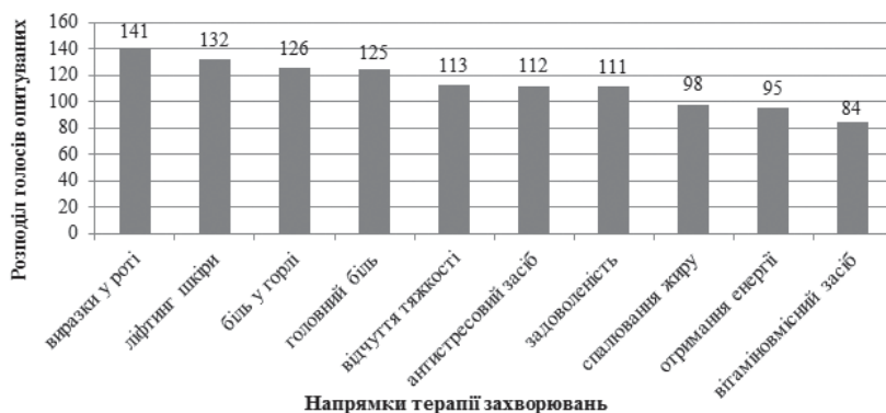
Рис. 1. Пріоритетні напрямки терапії лікувальними жувальними гумками на думку опитаних споживачів

кий асортимент спостерігається у ЛЖГ, що призначені для контролю ваги; що рекомендовані для застосування у стоматологічній практиці; енергетичних гумок та ЛЖГ, що покращують травлення (рис. 2).