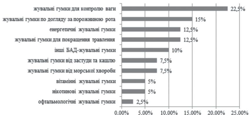
Рис. 2. Розподіл ЛЖГ за призначенням

На наступному етапі нами проведено аналіз фірмової структури фармацевтичного ринку у сегменті ЛЖГ (рис. 3).