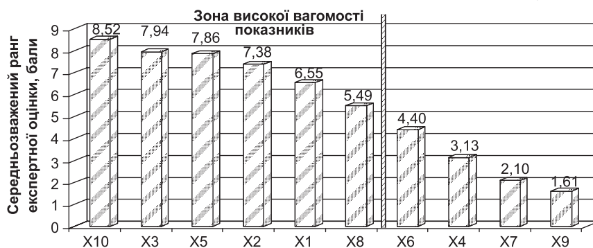
Рис. 3 Розподілення за рангами основних проблем у сфері управління інтелектуальними ресурсами у фармації на макрорівні:

Отже, як видно з рис. 3, основними проблемами у сфері управління ІР в фармації на макрорівні є недостатність інвестиційних ресурсів внаслідок незадовільного інноваційного клімату в Україні; нерозвиненість механізму державно-приватного партнерства в Україні; відсутність податкових пільг, що стимулюють інноваційну