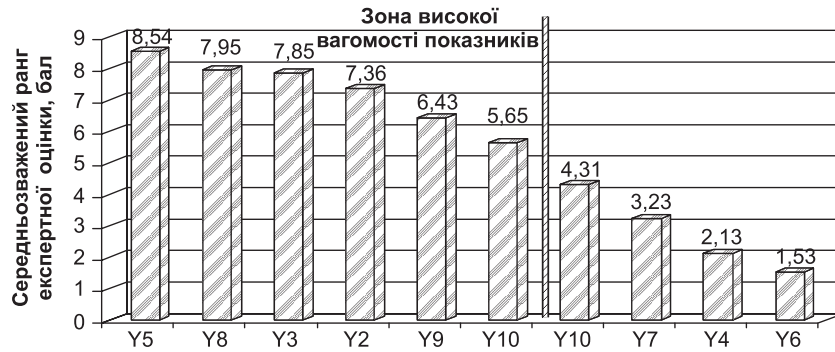
Рис. 4 Розподіл за рангами основних проблем у сфері управління інтелектуальними ресурсами в фармацевті на галузевому рівні:

Y5 – недостатнє державне фінансування наукових установ і ВНЗ, які займаються розробкою нових ЛЗ; Y8 – відсутність державних комплексних програм із пошуку, розробки та впровадження інноваційних ЛЗ із залученням як виконавців наукових установ, ВНЗ і ФК; Y3 – недостатня кількість грантів, стипендій, премій для молодих фахівців, які працюють у фармацевті; Y2 – недосконалість нормативно-правової бази щодо регулювання і захисту ОІВ у фармацевті (режим ексклюзивності не враховує особливості ЛЗ, наприклад, для педіатрії); Y9 – відсутність практики паспортизації та оцінки ІР всіх суб'єктів інноваційної і наукової діяльності, які розробляють ЛЗ; Y1 – відсутність недержавних цільових фондів для фінансування фундаментальних і прикладних досліджень у фармацевті та ін.; Y10 – обмежений досвід використання механізмів проектного фінансування у фармацевті; Y7 – нерозуміння керівниками різних рівнів доцільності реалізації кластерної моделі розвитку вітчизняної фармацевті; Y4 – практична відсутність фахівців з управління ІР і ІВ, обізнаних на специфіці фармацевті; Y6 – відсутність чіткої вертикалі в управлінні інноваційним розвитком і ІР в фармацевті