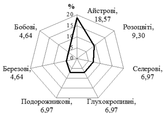
Рис. 1. Розподіл родин ЛР, ЛРС чи субстанції з яких є вихідною сировиною у ЛЗ гастроентерологічної спрямованості.

Мальвові (Malvaceae), Пасльонові (Solanaceae), Жимолостеві (Lonicereae), Валеріанові (Valerianaceae), Букові (Fagaceae), Капустяні (Brassicaceae), Вересові (Ericaceae), Звіробійні (Hypericaceae), Імбирні (Zingiberaceae), Кривові (Urticaceae), Жостерові (Rhamnaceae), Ламінарієві (Laminariaceae), Льонові (Linaceae), Маслинові (Elaeagnaceae), Макові (Papaveraceae). У загальному обсязі частка групи «Інші» — 41,94 %.