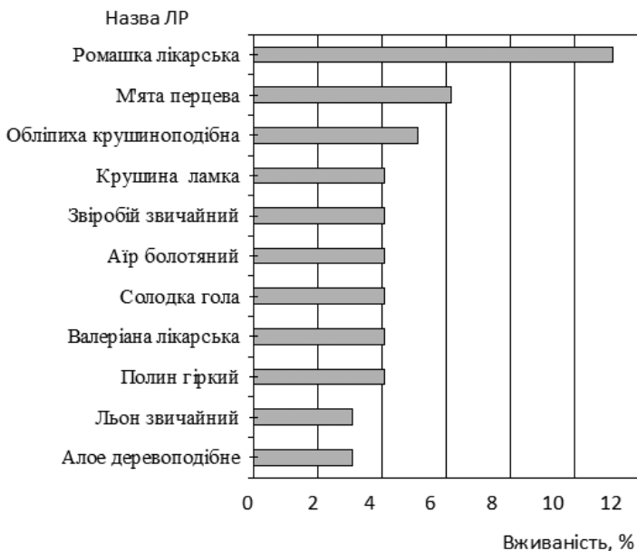
Рис. 2. Розподіл ЛР за вживаністю у складі ЛЗ для терапії хвороб ШКТ.

Із загальної кількості ЛР (48 видів) було виділено 11 видів найуживаніших ЛР, що наведено рис. 2.