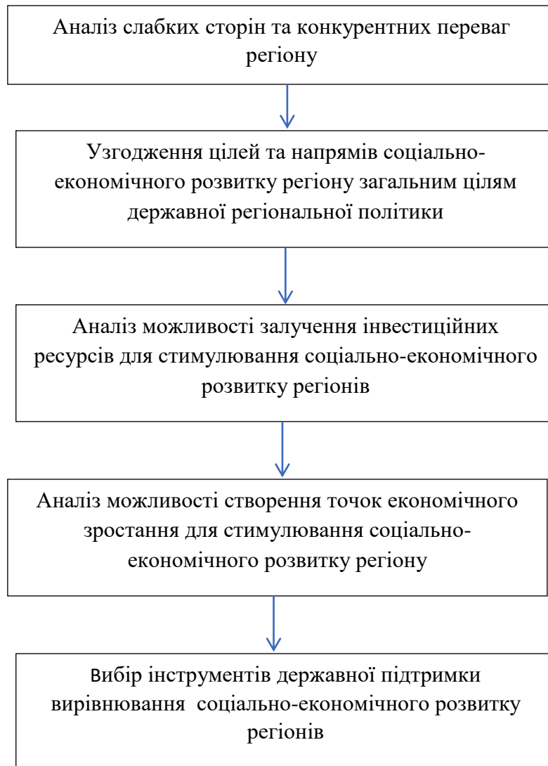
Рис. 2. Етапи вибору інструментів державної підтримки вирівнювання соціально-економічного розвитку регіонів України

вирівнювання соціально-економічного розвитку регіонів країни доцільно дотримуватися певного алгоритму, етапи якого наведено на рис. 2.