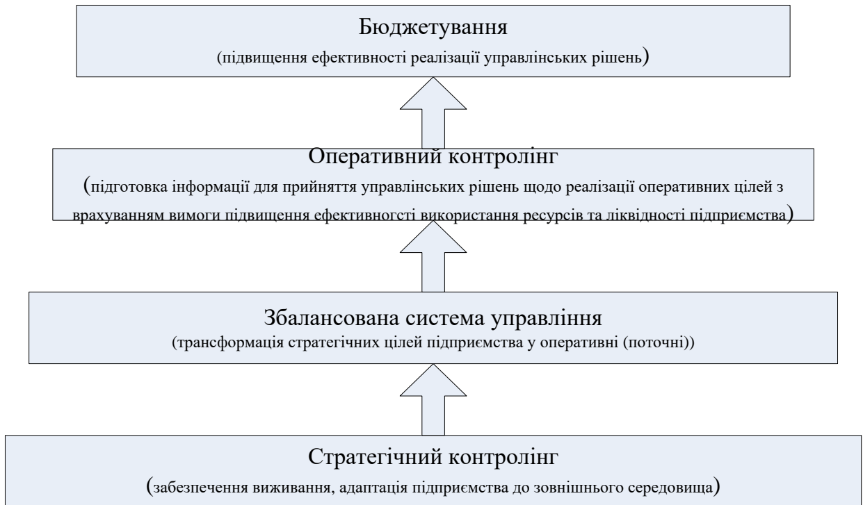
Рис. 1 Схема взаємозв'язку між підсистемами економічного управління

• неадитивність: взаємодія всіх підсистем на відміну від автономної їх дії дає синергійний ефект – взаємозв'язок стратегічної, оперативної та поточної діяльності підприємства, що дає змогу досягнення спільної мети на всіх рівнях управління;