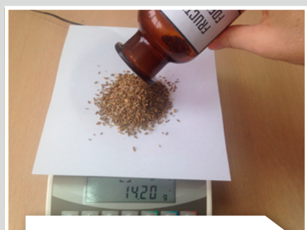
Отвешивают плоды фенхеля