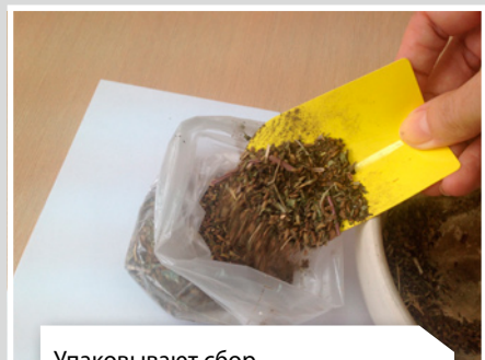
Упаковывают сбор в полиэтиленовый пакет