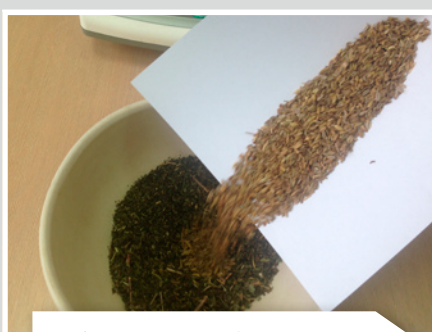
Добавляют плоды фенхеля в ступку