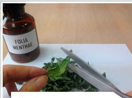
Измельчают лекарственное растительное сырье