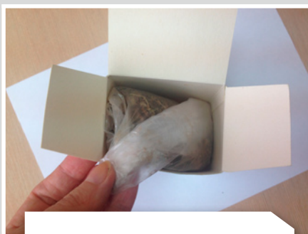
Помещают в картонную коробку