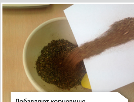
Добавляют корневище с корнями валерианы в ступку