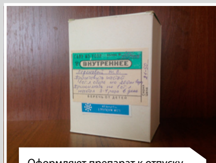
Оформляют препарат к отпуску