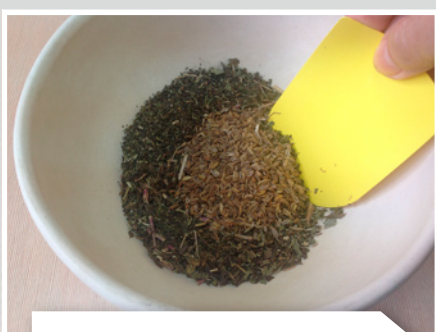
Перемешивают листья мяты и плоды фенхеля