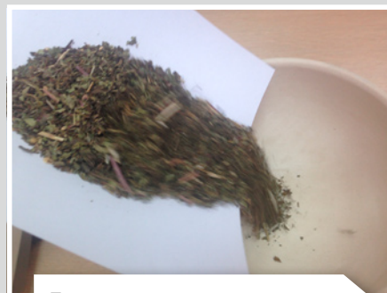
Помещают листья мяты в ступку