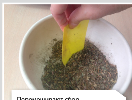
Перемешивают сбор до однородности