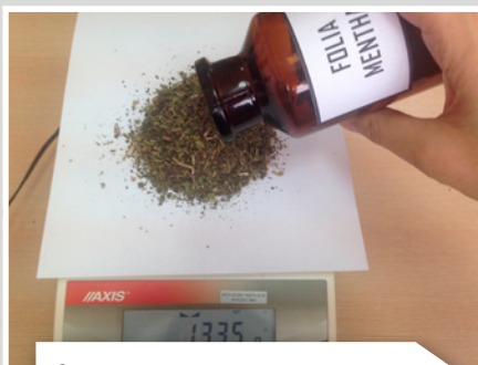
Отвешивают листья мяты