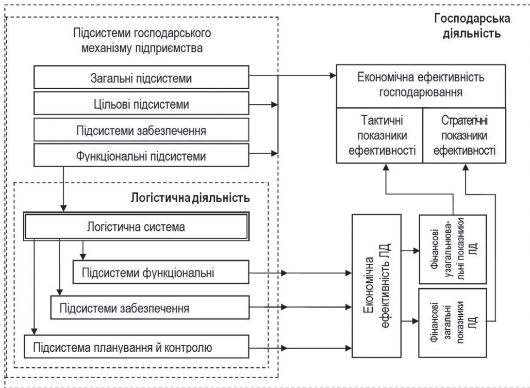
Рис. 1. Найвні зв'язки між ефективністю логістичної й господарської діяльності підприємства (авторська розробка)

Крім зазначеного вище, варто звернути увагу на той факт, що організація ЛД на виробничих підприємствах надає можливість здобути ще й синергійний ефект від взаємодії різних підсистем останніх. Тобто завдяки організації і планомірному здійсненню ЛД на підприємствах забезпечується ефект від взаємного посилення зв'язків між суб'єктами господарювання ринку на рівні матеріального потоку або спільний ефект взаємодії всіх підсистем логістичної системи (ЛС) підприємства в загальному процесі виробництва продукції і обслуговування споживачів визначеного сегмента ринку.