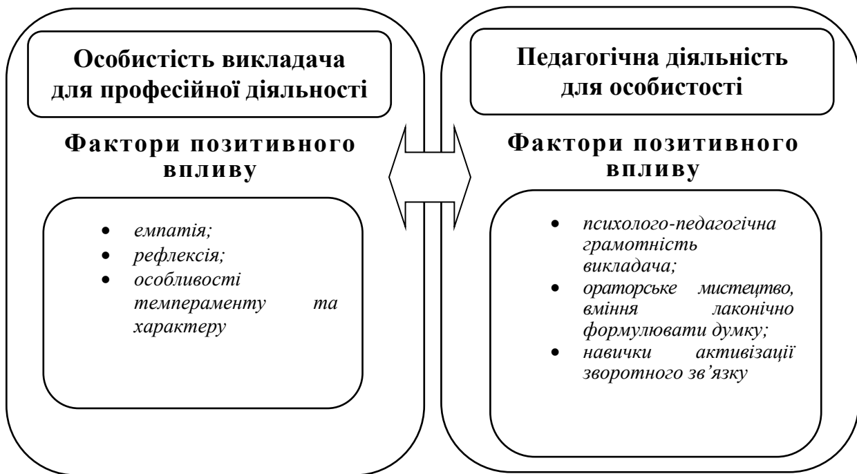
Рис. 2 Баланс факторів для запобігання вигорання та ефективної роботи викладача

Виходячи з відображеного матеріалу, можна зробити висновок, що існує певний баланс між інструментарієм «особистість викладача для професійної діяльності» та «педагогічна діяльність для особистості», який спрямований як на розвиток людини, так і на розвиток педагогічної праці як процесу, у якому праця не відчужується від особистості.