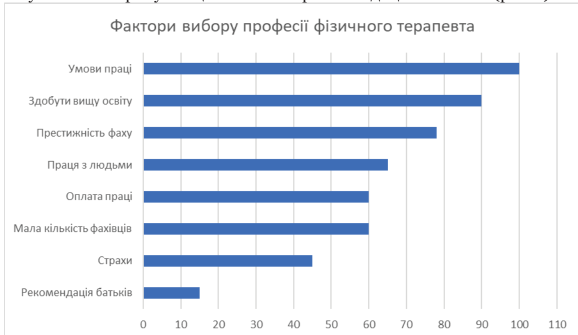
Рис. 1. Діаграма вирішальних факторів вибору професії фізичного терапевта

Спеціальність “Фізична терапія, ерготерапія” обрали майже у рівному гендерному співвідношенні: жінки – 55%, чоловіки – 45 %. За віком розподіл студентів такий: 17-18 років – 82%, 19-21 роки – 18 %. Відповідно більшість вступили до ЗВО після закінчення школи, а менша частина студентів, які раніше отримали спеціальну середню освіту у медичних училищах та коледжах. Вирішальними у виборі професії учасники анкетування називають найрізноманітніші фактори, до декількох у кожній анкеті. Найважливішим фактором більшість студентів вважають “умови праці”, їх обрали 100% опитаних, 90% та 78% відмітили фактор здобуття вищої освіти та престижність фаху відповідно; 65 % подобається праця з людьми, та для 60% має значення фінансової сторони – оплата праці, 60% пояснили вибір професії фізичного терапевта недостатньою кількістю кваліфікованих кадрів у цій галузі, 45% опитаних хотіли б обрати професію лікаря, але бояться відповідальності, отже обрали суміжну професію, та 15% вступили на обрану спеціальність за рекомендацією батьків (рис. 1).