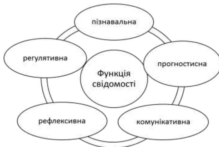
Рис 1. Функція свідомості

Розв'язання проблеми формування компетентності та професійної свідомості полягає у переорієнтацію загальної системи підготовки фахівця з урахуванням компонентів професійної свідомості, що проявляються у функціях свідомості рис. 1.