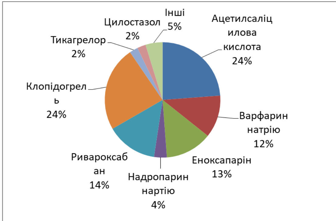
Рис. 3. Аналіз асортименту антитромботичних лікарських засобів за МНН.

Аналіз усіх антитромботичних лікарських засобів за МНН (рис. 3.) встановив, що найбільші долі склали препарати з МНН Ацетилсаліцилова к-та та Клопідогрель – по 24% асортименту. Ривароксбан та Еноксапарин склали по 14% та 13% відповідно. ЛЗ з діючою речовиною варфарин натрію склали 12% асортименту усіх ЛЗ.