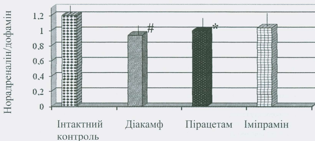
Рис. 1. Порівняльний аналіз діакамфу, пірацетаму та іміпраміну за співвідношенням норадреналін/дофамін у головному мозку мишей.

Як відомо, норадреналін синтезується в головному мозку з дофаміну, адреналін частково теж може утворюватися з норадреналіну в головному мозку [11, 13]. Для з'ясування взаємозв'язку між рівнями дофаміну та норадреналіну обчислювали коефіцієнт лінійної кореляції Пірсона (рис. 2), який складає: 0,36 (контроль), 0,93 (пірацетам), 0,99 (діакамф), 0,80 (іміпрамін). Тобто під дією всіх препаратів спостерігалось достовірне підсилення взаємозв'язку між рівнями дофаміну та норадреналіну. Подібні зміни спостерігались у парі норадреналін-адреналін: коефіцієнт кореляції складає: 0,13 (контроль), 0,98 (пірацетам), 0,99 (діакамф), 0,46 (іміпрамін). Також спостерігалась тенденція посилення зв'язку між дофаміном та адреналіном, коефіцієнт кореляції складає: 0,24 (контрольні тварини), 0,93 (пірацетам), 0,997 (діакамф), 0,92 (іміпрамін). Можли-