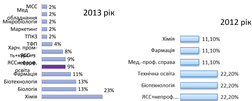
Рис. 2. Кваліфікації за дипломом претендентів на посади фахівців із ЗЯ/УЯ

«Якість, стандартизація та сертифікація» (ЯСС), а прагнення працювати за даним напрямом базувалось загалом на наявності прослуханих короткотривалих (переважно тижневих) курсів підвищення кваліфікації у сфері ЗЯ/УЯ, що не дозволяє отримати професійні вміння та навички у повному обсязі. Дані щодо освіти в резюме за 2013 рік вказують, що лише 9% претендентів мають фармацевтичну освіту у поєднанні з освітою за спеціальністю «ЯСС», що є найбільш доцільним для цих посад (рис. 2).