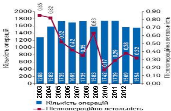
Рис. 3. Количество оперативных вмешательств при ЖКБ и послеоперационная летальность в городе Киеве

На основе литературных данных существует классификация желчегонных препаратов (табл. 1).