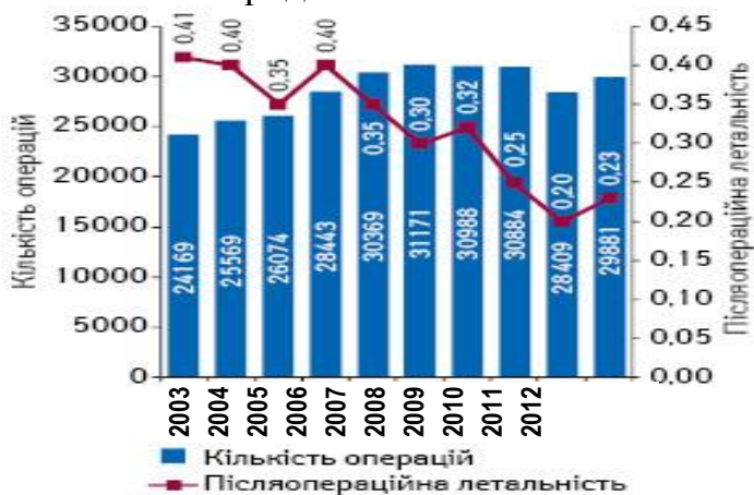
Рис. 2. Количество оперативных вмешательств при ЖКБ и послеоперационная летальность в Украине