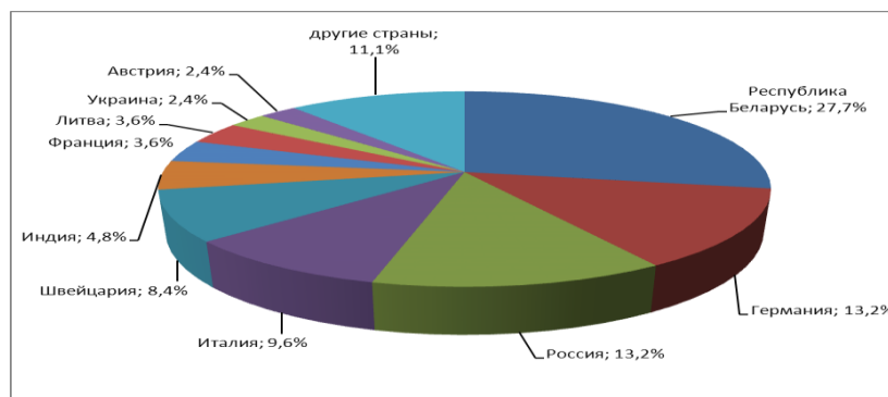
Рис. 1 Распределение производителей противоопухолевых лекарственных препаратов, которые представлены в ассортименте исследуемой аптеки, по странам

Среди лекарственных форм, представленных в аптеке противоопухолевых препаратов, более 80% занимают растворы для инъекций, концентраты и порошки для приготовления растворов для инъекций и инфузий. Твердые лекарственные формы занимают менее 20% в ассортименте изучаемой фармако-терапевтической группы (рис. 2).