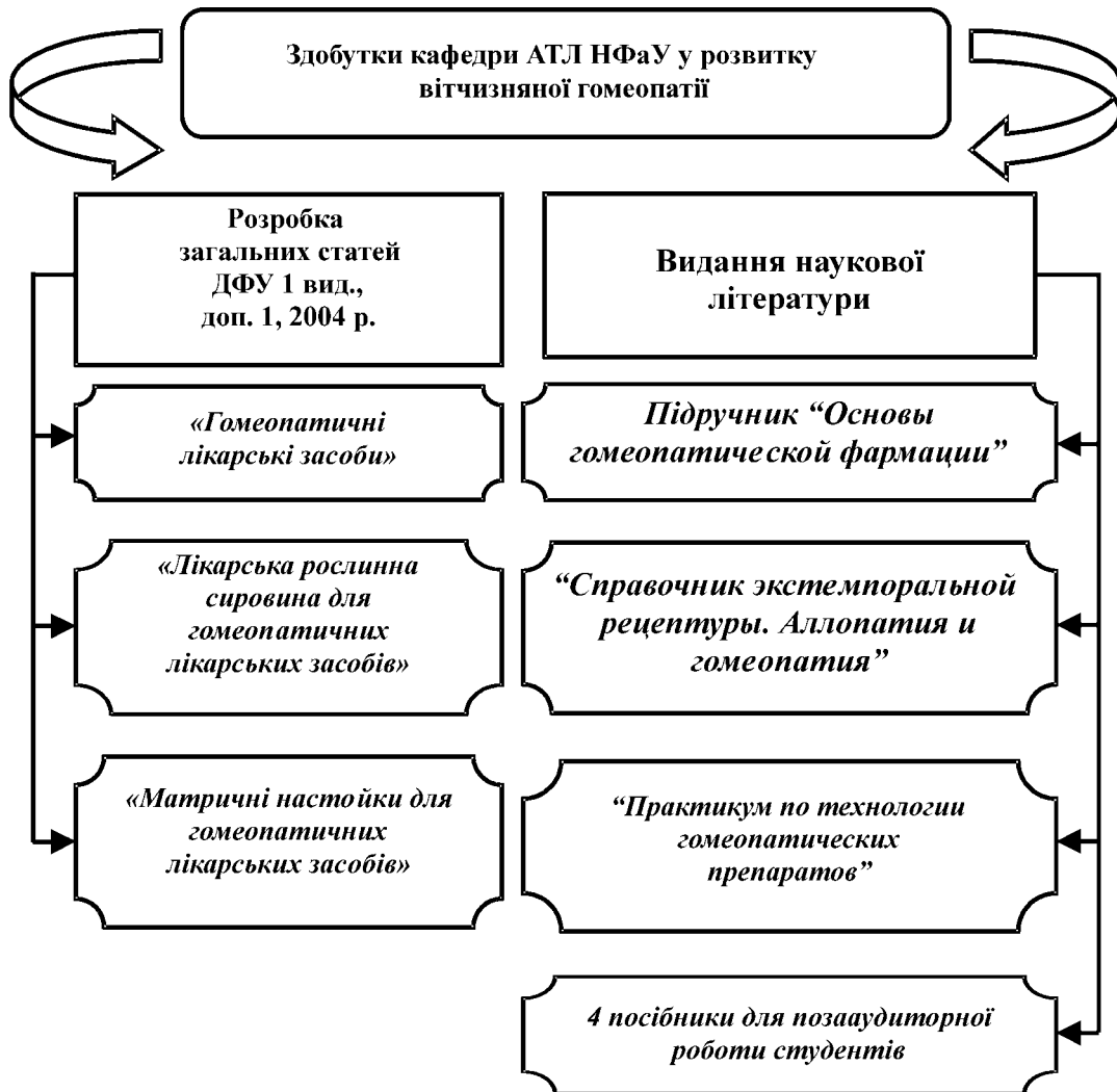
Рис. 1. Внесок кафедри АТЛ у розвиток гомеопатії в Україні

кументом, оскільки гомеопатичні ЛЗ не були включені до жодної з державних фармакопей СРСР та не мали фармакопейного статусу.