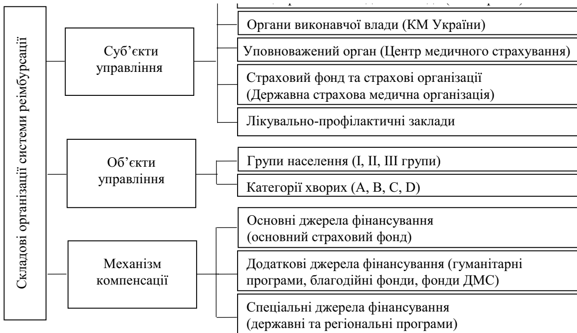
Рис. 1. Методологічні засади та складові організації систем реімбурсації вартості ЛЗ у межах соціального медичного страхування

В — хворі загальнотерапевтичного профілю (з гострими формами захворювань);