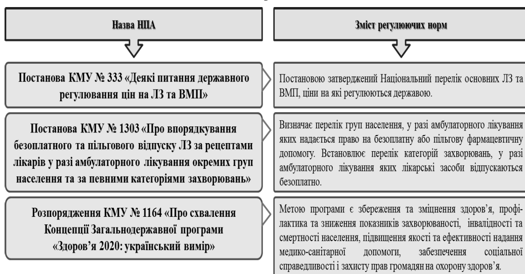
Рис. 2. Аналіз НПА другого рівня ієрархії, що регулюють ФЗ осіб похилого та старечого віку в Україні