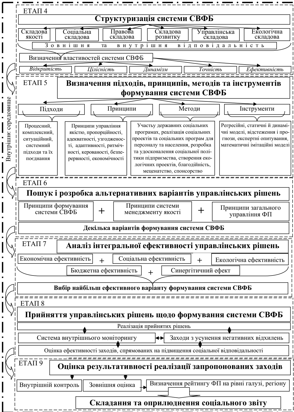
Рис. 1. Алгоритм формування системи СВФБ (закінчення)