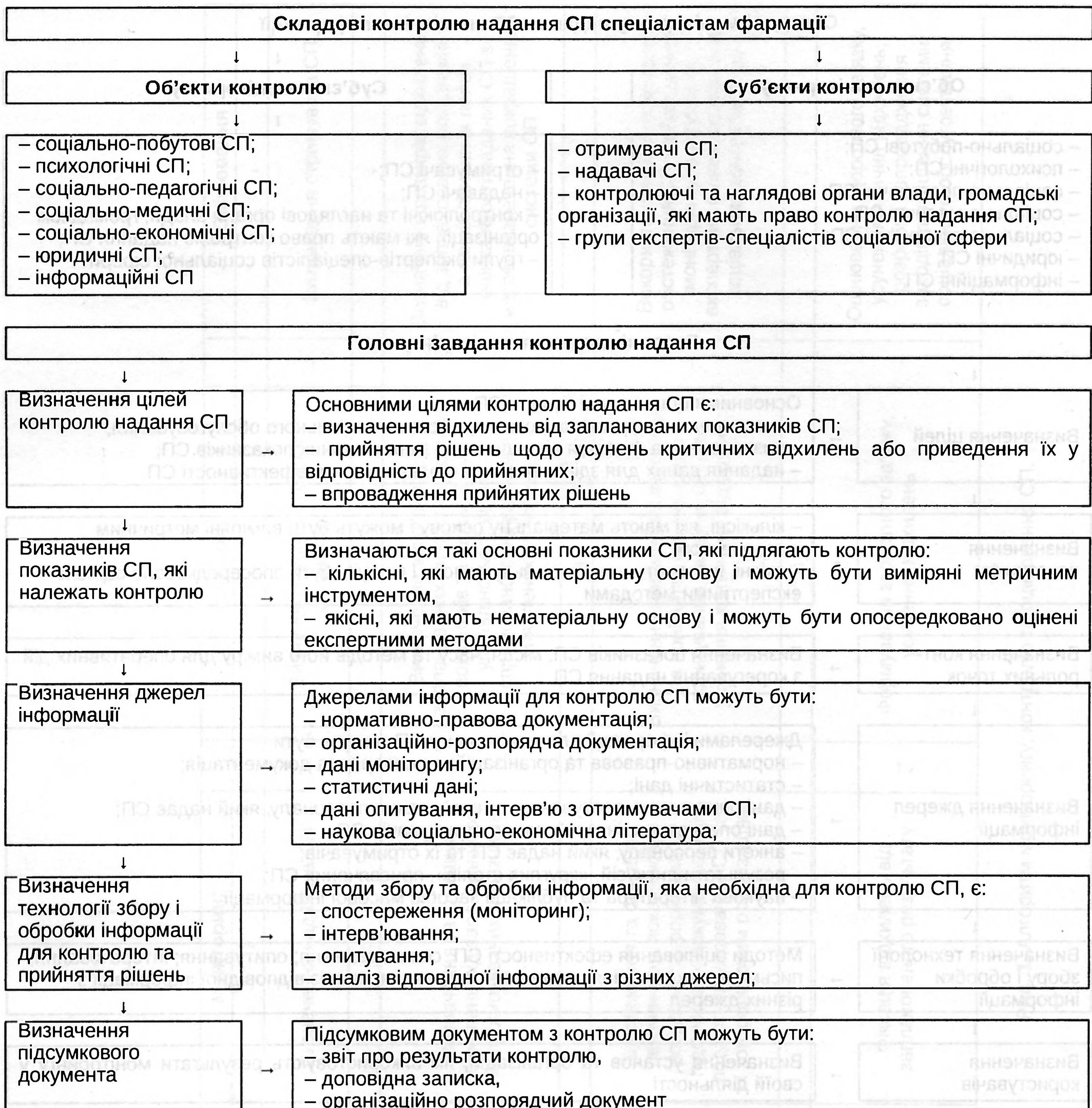
Рис. 3. Алгоритм контролю надання СП спеціалістам фармації.

Організаційно-розпорядчий документ – це форма службового документа, в якому міститься інформація про результати контролю СП та відповідні розпорядження щодо усунення виявлених відхилень та недопущення їх надалі. Основними організаційно-розпорядчими документами можуть бути розпорядження, доручення, вказівка, наказ, рішення.