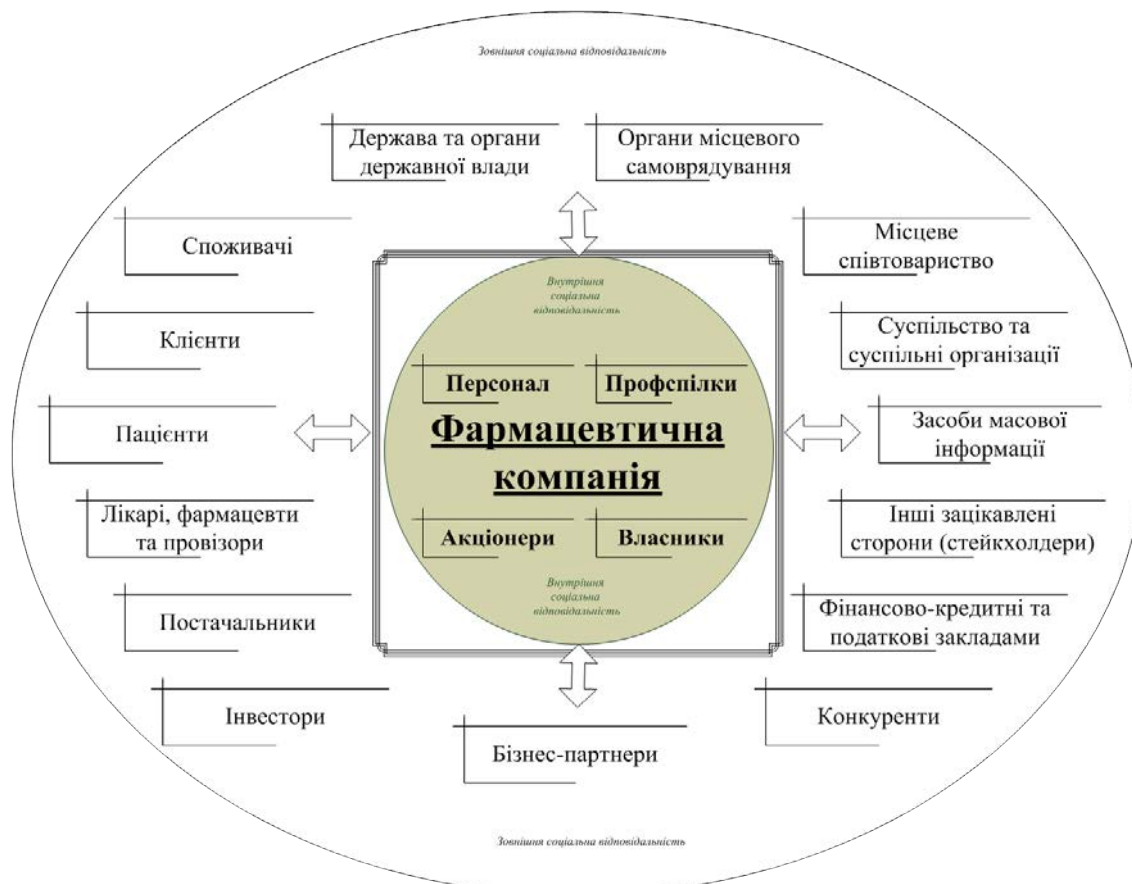
Рис. 2. Об'єкти (стейкхолдери) соціальної відповідальності фармацевтичного бізнесу