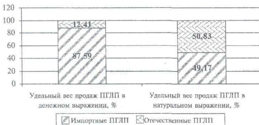
Рис. 2. Соотношение объемов продаж отечественных и импортных ПГЛП

объемам продаж в денежном выражении преобладают импортные ПГЛП (87,59%), а в натуральном – отечественные компании, которые в последние годы усилили свои позиции (50,83%) (рис. 2).