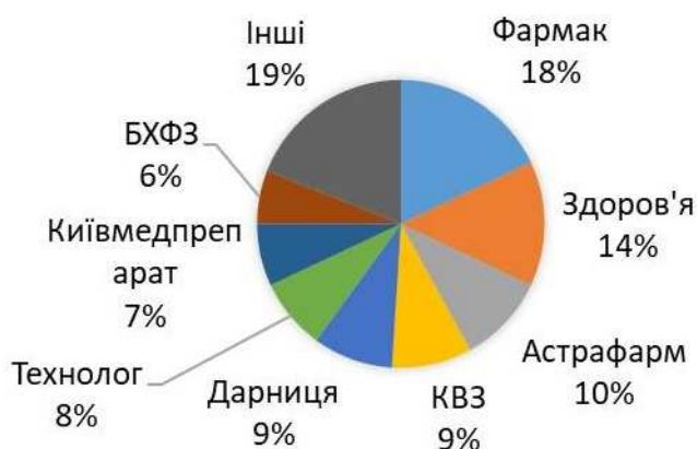
Рис. 2. Аналіз асортименту ЛЗ серцево-судинної дії українського виробництва за фірмою-виробником

За результатами аналізу асортименту ЛЗ серцево-судинної дії що містяться у Реєстрі лікарських засобів, вартість яких підлягає відшкодуванню станом на 21 січня 2019 року вироблених в Україні за фірмою виробником (рис. 2.) було встановлено, що найбільшу частку досліджуваного асортименту складають ЛЗ вироблені ПАТ «Фармак» 18%. Лікарські засоби виробництва інших українських компаній- виробників склали: ТОВ «Фармацевтична компанія «Здоров'я» 14%, ТОВ «Астрафарм» 10%, АТ «Київський вітамінний завод» і ПрАТ «Фармацевтична фірма «Дарниця» по 9%, ПрАТ «Технолог» 8%, ПАТ «Київмедпрепарат» 7%, Публічне акціонерне товариство "Науково- виробничий центр «Борщагівський хімікофармацевтичний завод» 6%. До групи Інші (19%) увійшли ЛЗ фармацевтичних виробників частина долі яких становить менше 4% – (Приватне акціонерне товариство «Лекхім-Харків», Товариство з обмеженою відповідальністю «Дослідний завод «ДНЦЛЗ», ТОВ «Кусум Фарм», Україна/ Товариство з обмеженою відповідальністю «Агрофарм», ТОВ НВФ «Мікрохім», ПАТ «Лубнифарм», ПАТ «Монфарм», ТОВ «Фармекс груп», ПАТ «Хімфармзавод «Червона зірка»).