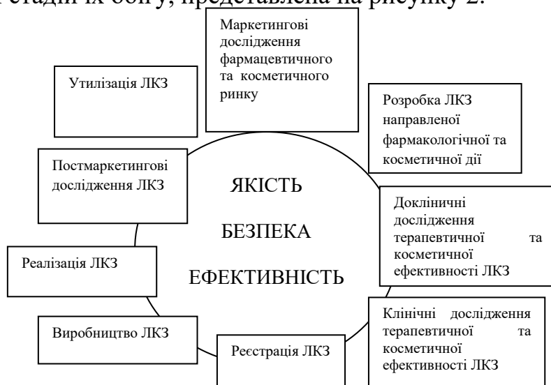
Рис. 2. Схема життєвого циклу ЛКЗ

Для об'єктивної стандартизації ЛКЗ доцільним є впровадження процесів дослідження та контролю її ефективності на протязі усього циклу обігу продукції. Нами розроблена схема життєвого циклу ЛКЗ, яка конкретизує особливості стадій їх обігу, представлена на рисунку 2.