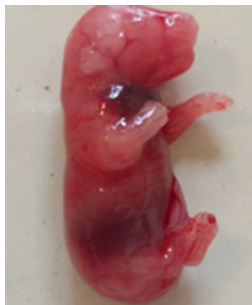
Рис. 1. Плод щура 20 день вагітності, гематома на шиї

Примітки: * - відхилення показника вірогідності відносно тварин інтактної групи, p \leq 0,05 ; ** - відхилення показника вірогідності відносно тварин групи з ФПН, p \leq 0,05 .