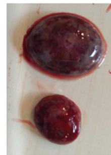
Рис. 4. Плацента, 20 день вагітності, інтактна (маленька) та група ФПН+дипіридабол (велика)

Після корекції цього стану фармацевтичною композицією спостерігали у плодів жіночої та чоловічої статі нормалізацію всіх показників.