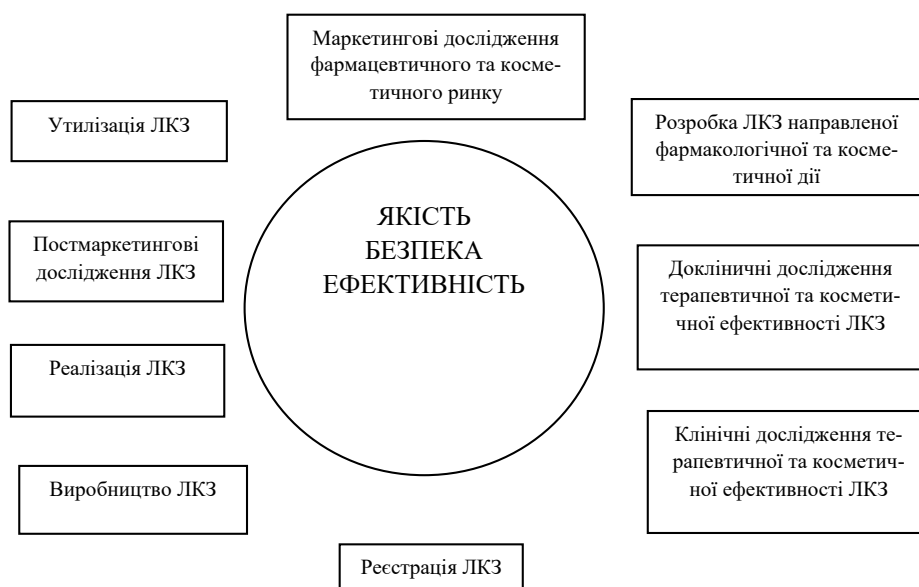
Рис.2. Схема життєвого циклу ЛКЗ

Таким чином, стандартизація ЛКЗ потребує впровадження системи управління якістю (СУЯ) на протязі усього циклу обігу продукції із врахуванням її специфічних особливостей порівняно із традиційними лікарськими засобами. Питання забезпечення належної стандартизації є одним із основних в системі управління якістю (СУЯ). Тим не менш, очевидним є той факт, що рівень застосування СУЯ у діяльність української косметичної індустрії не відповідає світовому досвіду ефективного управління, що є однією з причин недосконалості системи стандартизації вітчизняної косметичної продукції. За нашими оцінками, саме використання сучасних моделей СУЯ на всіх етапах життєдіяльності лікарської косметичної продукції може стати запорукою підвищення її конкурентоспроможності і каталізатором подальшого розвитку вітчизняної косметичної промисловості в цілому.