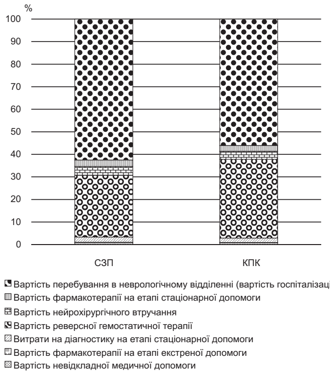
Рис. 2. Структура витрат на лікування пацієнта з ВМК

Аналіз чутливості результатів проведено до зміни параметрів ефективності з урахуванням наявності відмінностей цих ключових параметрів, а також до зміни ціни на препарати РГТ в межах \pm 50\% .