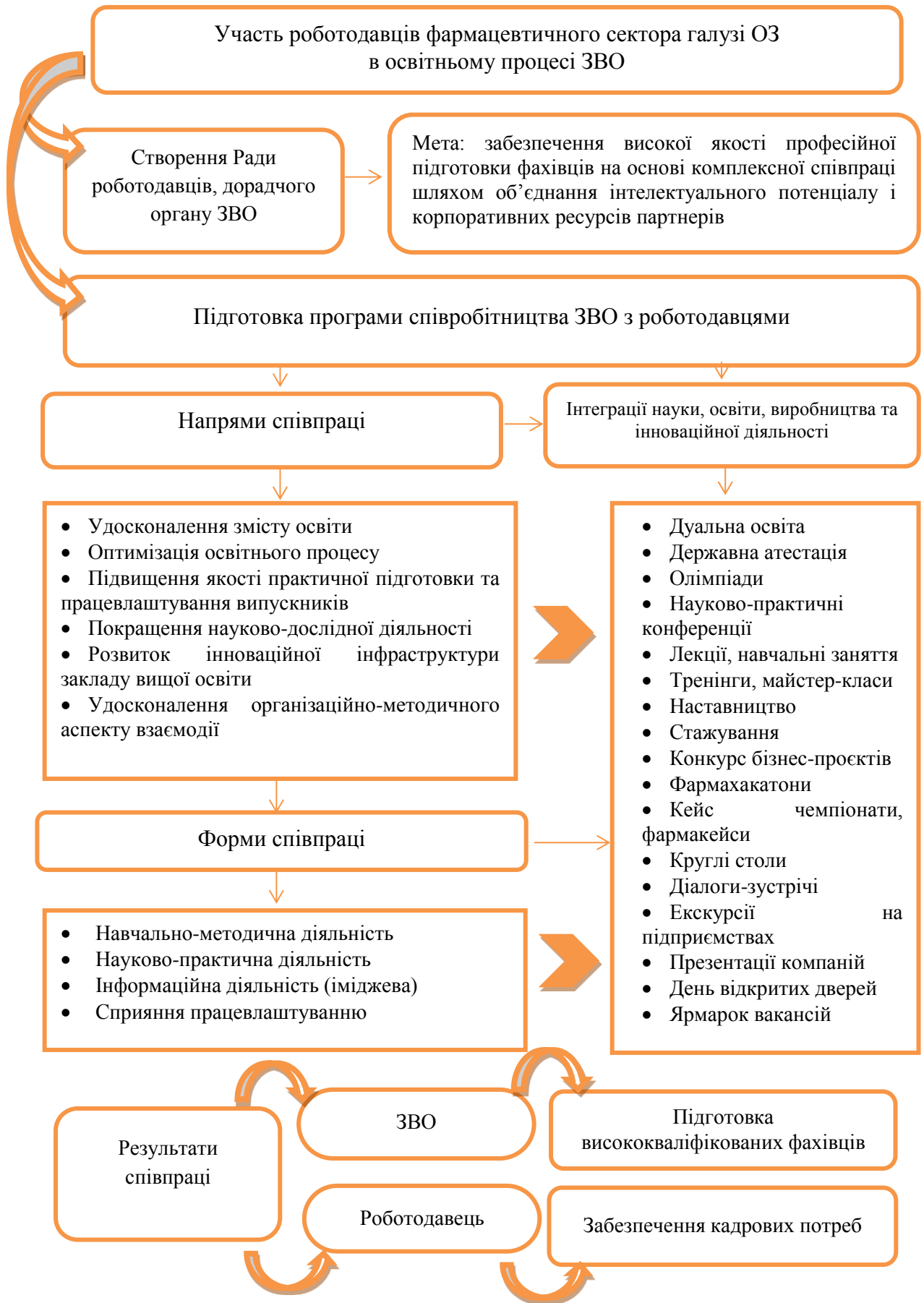
Рис. 4 Модель співробітництва ЗВО з роботодавцями фармацевтичного сектора галузі ОЗ