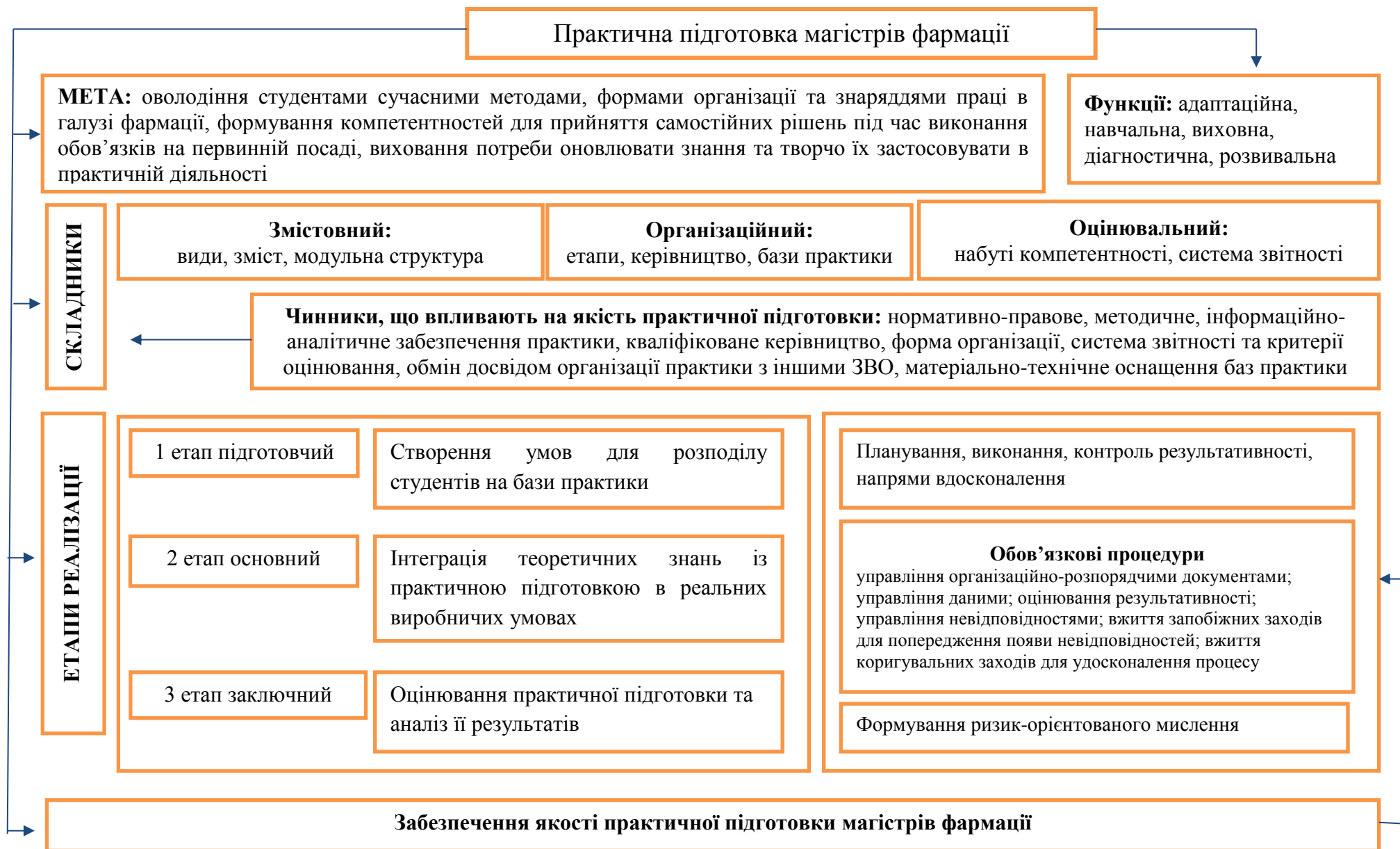
Рис. 2 Модель організації практичної підготовки магістрів фармації