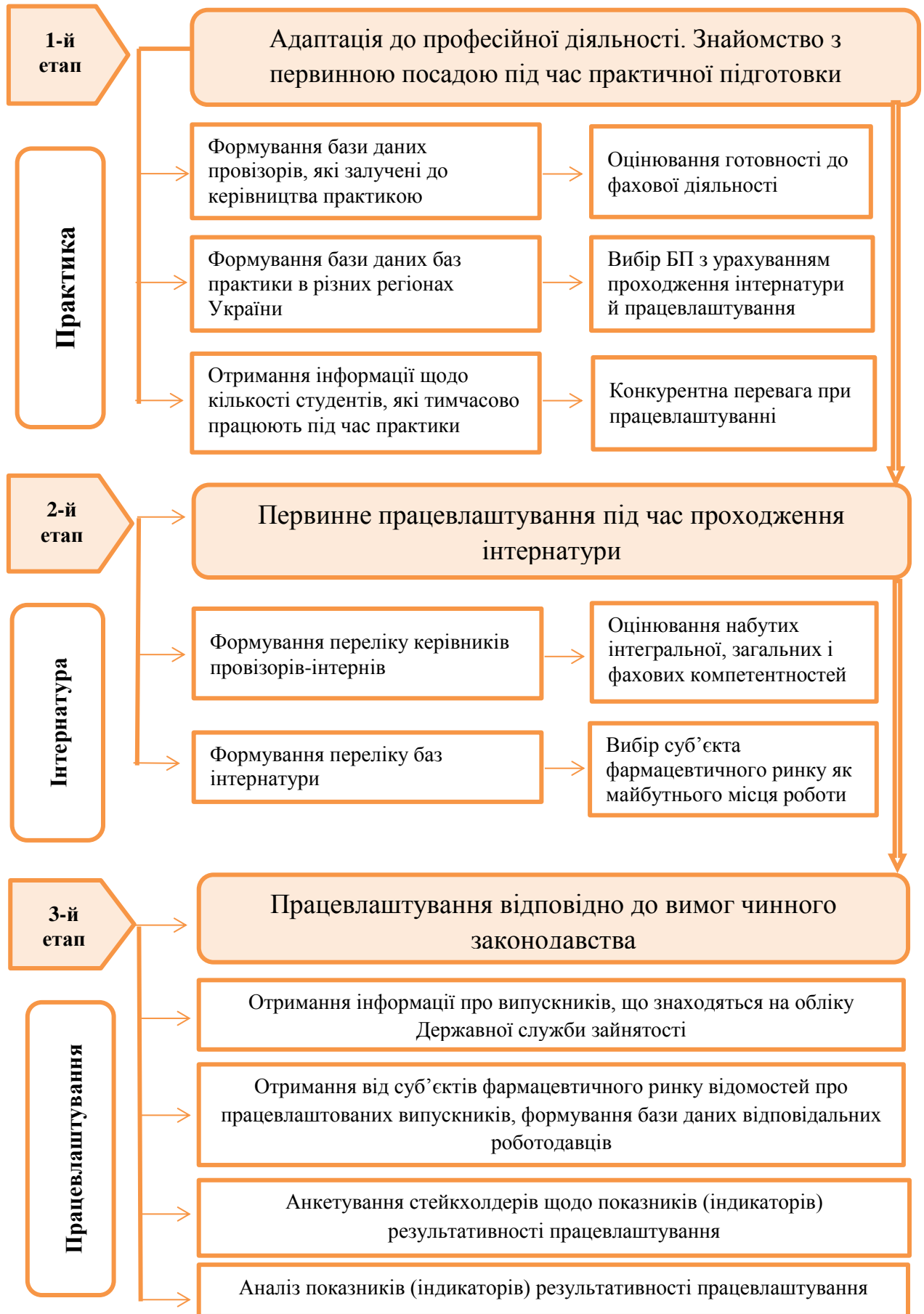
Рис. 5 Етапи працевлаштування магістрів фармацевції