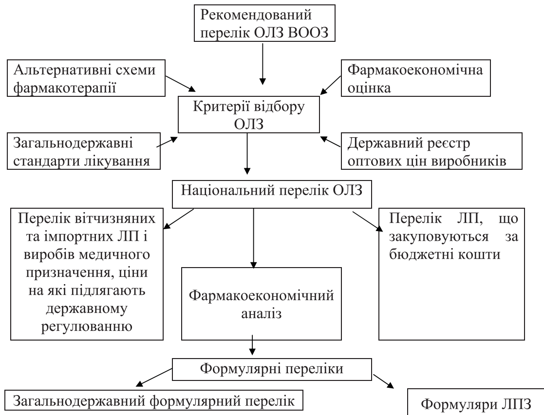
Рис. 1. Підходи до формування регулюючих переліків ЛП, що застосовуються при лікуванні потерпілих у НС.

Вирішення завдань здійснювалось на основі системного вивчення та порівняльного аналізу вітчизняних і закордонних підходів до надання невідкладної допомоги населенню при виникненні НС.