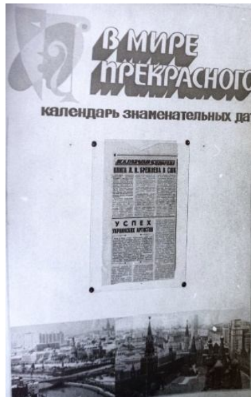
Календар знаменних і пам'ятних дат

У бібліотеці вели календар знаменних і пам'ятних дат, формувались списки рекомендаційної літератури, що відповідали заданій тематиці або приурочені святу.