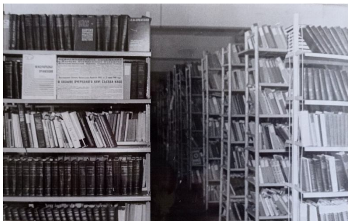
Бібліотека Харківського хіміко-механічного технікуму 1970-х рр.