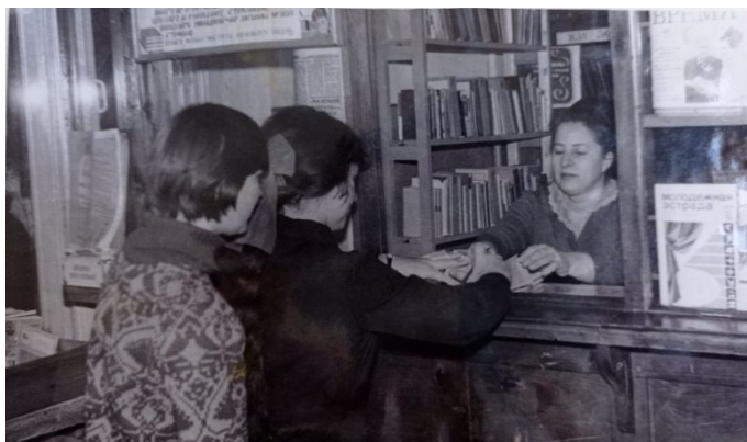
Бібліотека Харківського хіміко-механічного технікуму 1980-х рр.