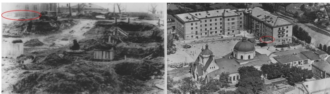
Харківський хіміко-механічний технікум 1950-х рр.

У 1955р. бібліотека отримала нове приміщення у новоствореному відбудованому корпусі (Невського, 18), в якому організовано роботу абонементу, читального залу та книгосховища.