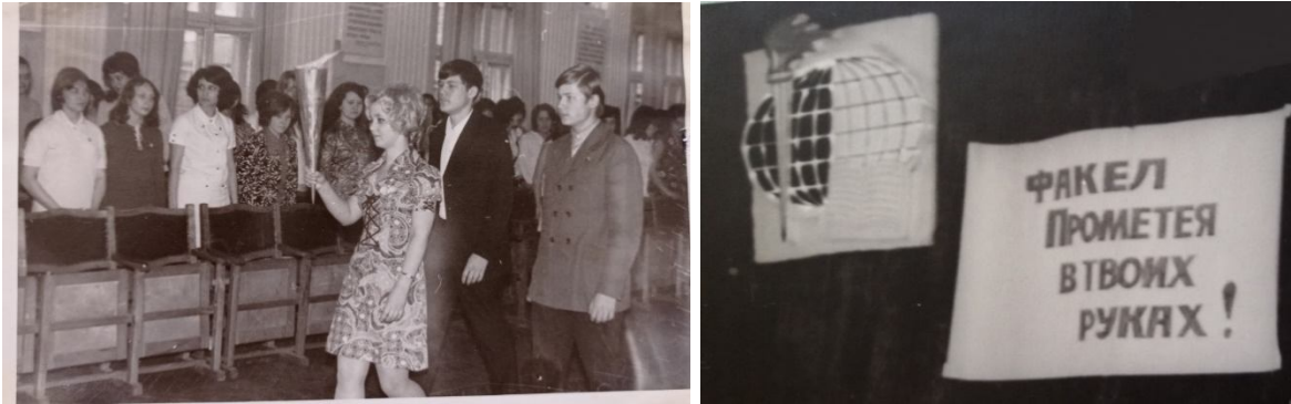
Засідання клубу “Прометей” (1968 р.)

клуб “Прометей” (створено в 1968р.), головне завдання якого полягало в прищепленні любові до книги, а через неї виховання високої моральності та патріотизму [4]. Роботу «Прометею» координувала адміністрація технікуму та профспілковий комітет. Клуб мав власний статут, емблему та девіз « смолоскии Прометейя в наших руках ».