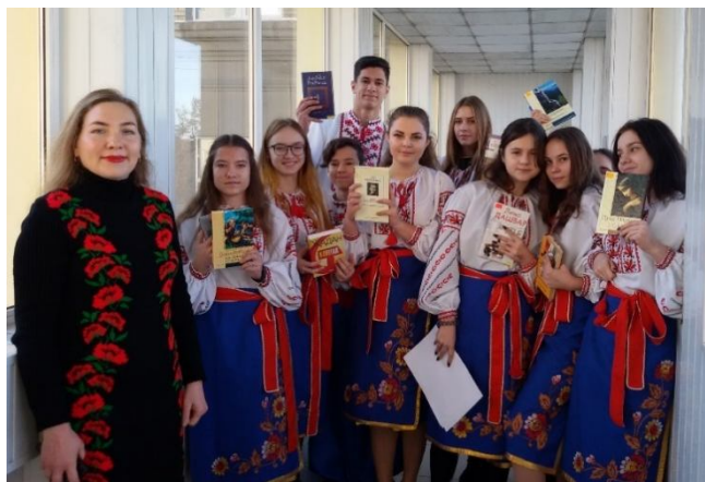
Флешмоб «Люби своє - читай українське»

багато інших форм, які добре зарекомендували себе на протязі багатьох років. Найбільш поширеними є тематичні виставки, які формують основні засади громадянського, морального, правового та художньо-естетичного виховання.