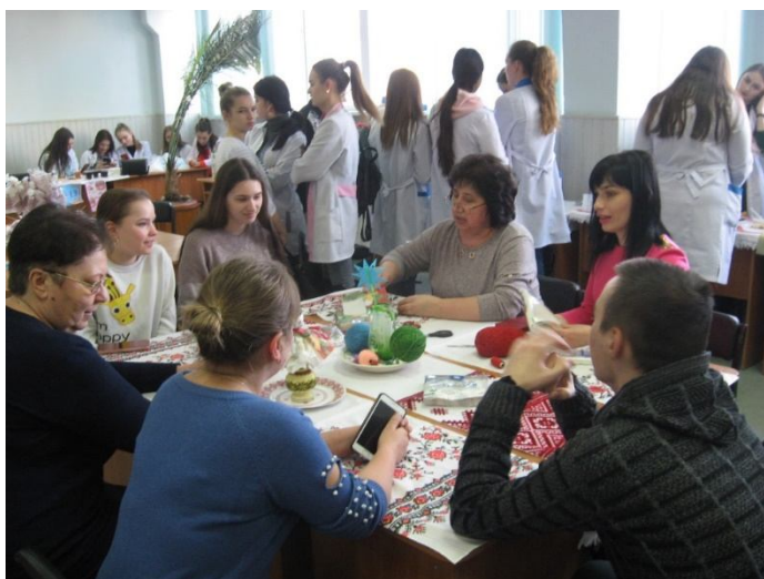
Майстер-клас з виготовлення мотанки до свята Масляна

Інноваційність у проведенні просвітницьких заходів проявляється в наявності елементів дискусійності, проблемності, театралізації у викладі інформації, включення ігрових моментів, використання новітніх інформаційних технологій, у залученні читачів до участі в самому заході.