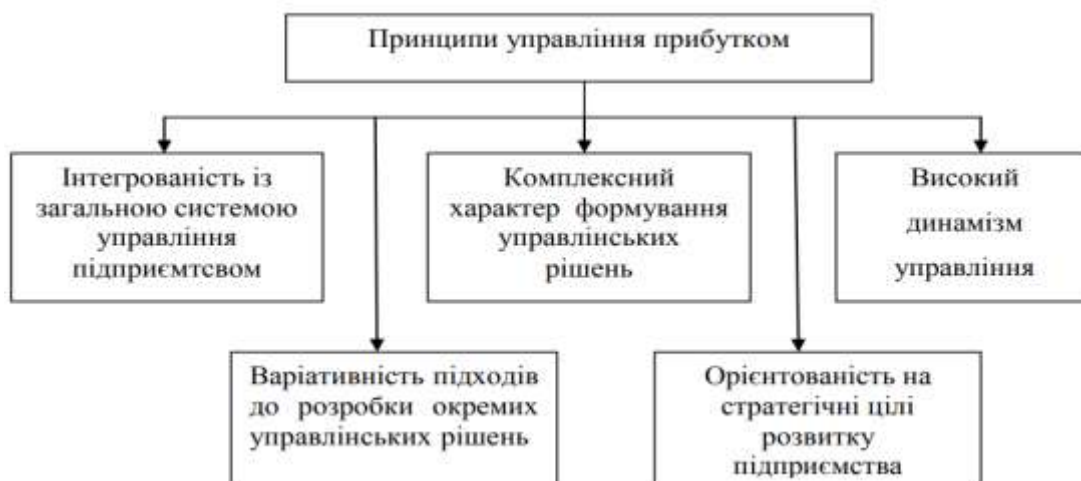
Рис. 1. Основні принципи управління прибутком підприємства