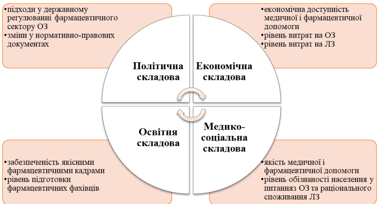
Рис. 1. Критерії ефективності системи фармацевтичного забезпечення населення

соціальну складову ефективності фармацевтичного забезпечення населення країни. І, безумовно, невід’ємною складовою даної системи, що безпосередньо впливає на кінцеві результати і ефективність фармацевтичного забезпечення, є освітня складова – забезпечення підготовки якісних кадрів для фармацевтичного сектору сфери ОЗ, їх професійного розвитку та післядипломної освіти [15]. Отже, усі критерії ефективності системи фармацевтичного забезпечення населення можуть бути оцінені за запропонованими складовими (рис. 1).