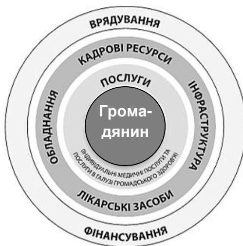
Рис. 2. Реалізація пацієнт-орієнтованого підходу в управлінні ОЗ [15]

Ключовими моментами є пацієнт-орієнтований підхід та діджиталізація бізнес-процесів, особливості реалізації яких в управлінні системою ОЗ та фармації представлено на рис.2.