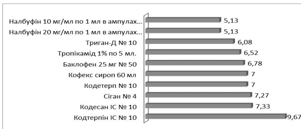
Рис. 1. Попит препаратів, що викликають наркотичну залежність