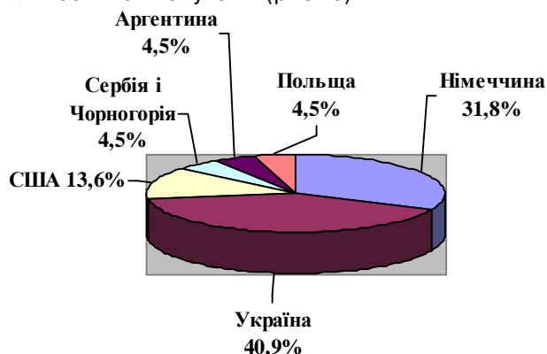
Рис. 3. Діаграма структуризації ринку тиреотропних препаратів залежно від країни-виробника.

Імпортні тиреотропні препарати на фармацевтичному ринку України представляють 5 країн, з яких значну частку займають лікарські засоби з Німеччини (31,8 %), на другому місці – США (13,8 %), потім – Сербії і Чорногорії, Аргентини та Польщі, відсоткова частка поставок даних препаратів з цих країн по 4,5 % від загальної кількості найменувань (рис. 3).