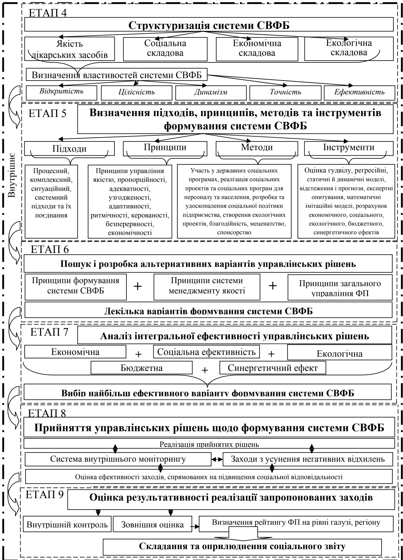
Рис. 1. Механізм формування СВФБ (закінчення)