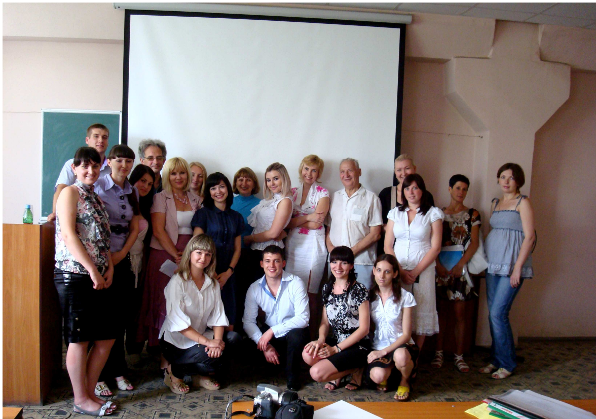
Після складання Державного іспиту за фахом студентами спеціальності «Економіка підприємства» денної форми навчання (2011 р.)