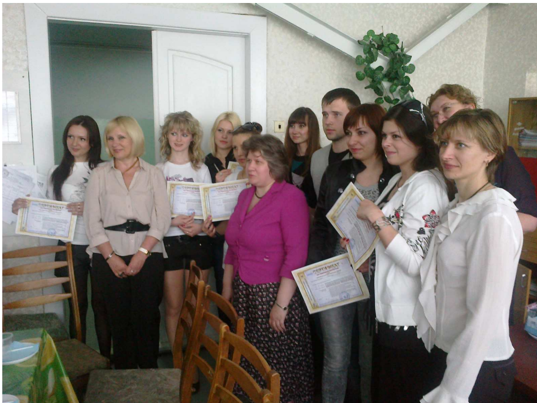
Вручення студентам сертифікатів про закінчення комп'ютерних курсів (2011 р.)

З метою підвищення ефективної самопідготовки студентів розроблена Web-сторінка кафедри ( www.kafedra-uer.kh.ua ), на якій розміщені навчально-методичні матеріали (лекційний матеріал, методичні рекомендації до практичних і семінарських занять, навчальні посібники, підручники, монографії, тестові завдання та ін.).