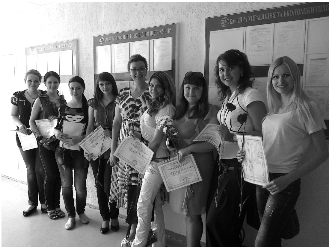
Вручення сертифікатів про закінчення комп'ютерних курсів (2012 р.)