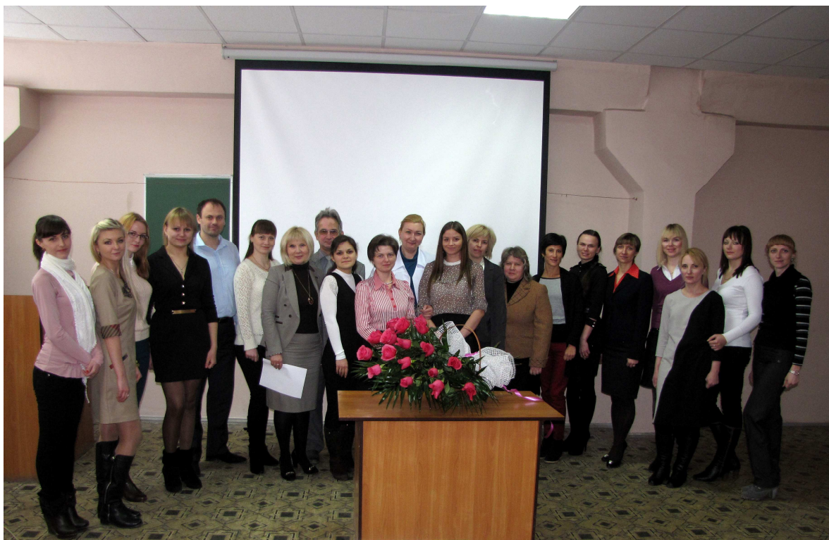
Після складання Державного іспиту за фахом зі спеціальності «Економіка підприємства» студентами заочної форми навчання (2011 р.)