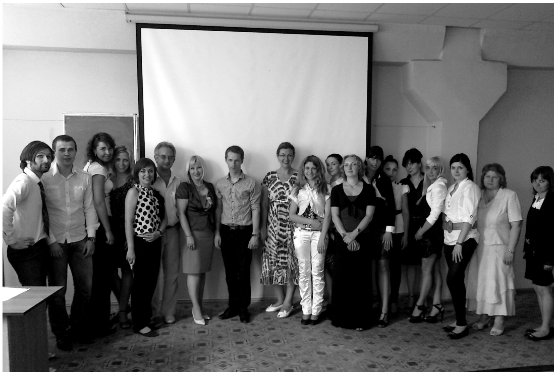
Після захисту дипломних магістерських робіт зі спеціальності «Економіка підприємства» (2010 р.)