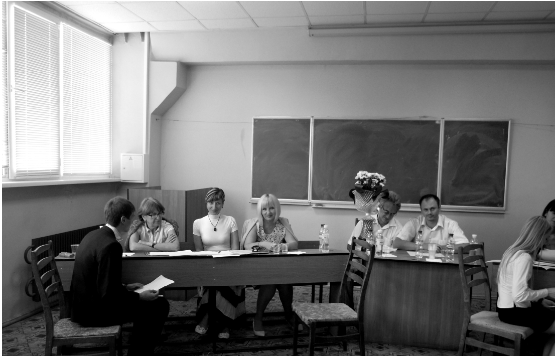
Складання Державного іспиту за фахом зі спеціальності «Економіка підприємства» (2012 р.)

Кафедра здійснює керування дипломними і магістерськими роботами студентів спеціальностей «Економіка підприємства» та «Логістика», а також консультування економічної частини дипломних проєктів зі спеціальностей «Технологія фармацевтичних препаратів» і «Біотехнологія».