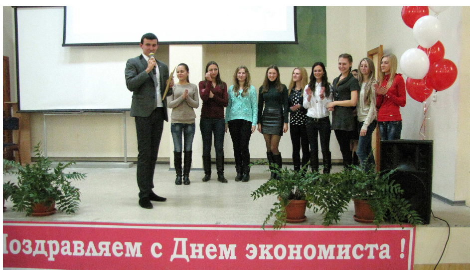
Нагородження переможців – студентів п'ятого курсу спеціальності «Економіка підприємства» (2014 р.)