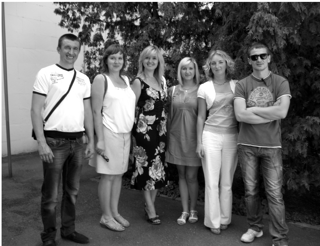
Зустріч випускників 2004 р.

Викладацьким складом кафедри постійно підтримуються контакти з випускниками спеціальності «Економіка підприємства» і «Логістика». Доброю традицією вже стало запрошення випускників різних років на святкування Дня економіста.