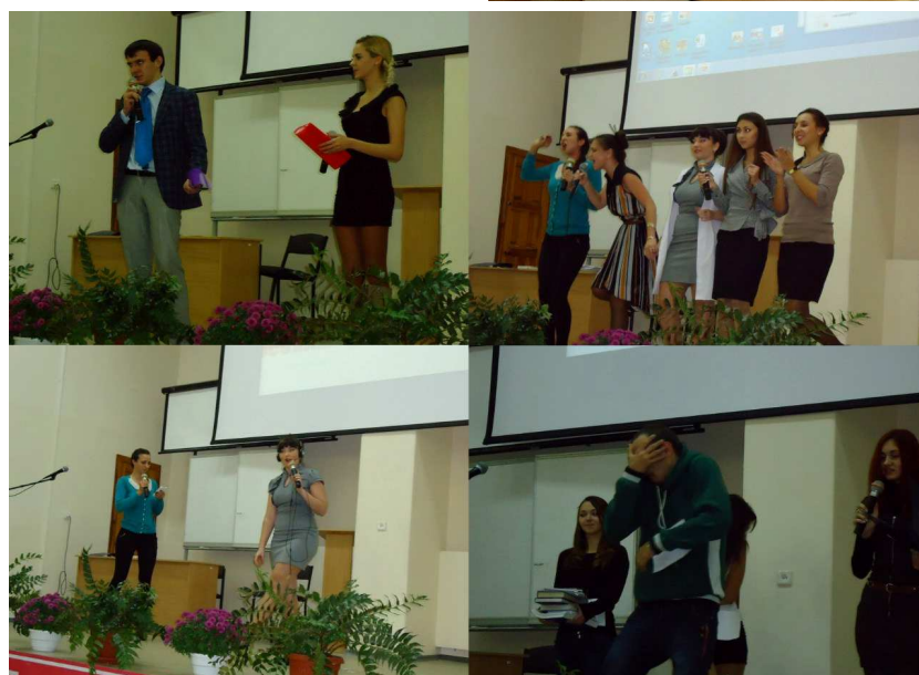
Економісти і логістики змагаються за призові місця (2014 р.)