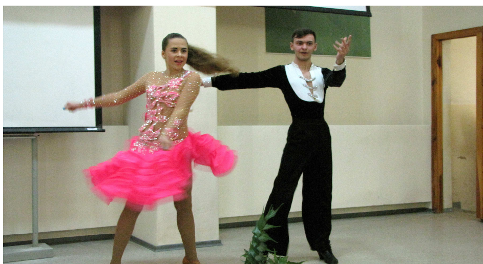
Студенти 4-го курсу спеціальності «Економіка підприємства» неперевершено танцюють «Фламенко» (2014 р.)