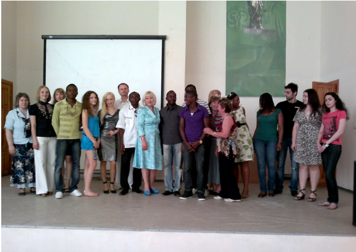
Зустріч викладачів кафедри з іноземними студентами підготовчого факультету