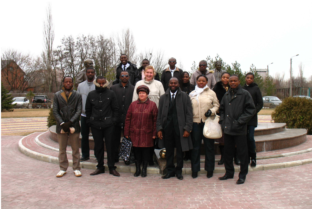
Екскурсія, організована співробітниками кафедри для студентів підготовчого факультету