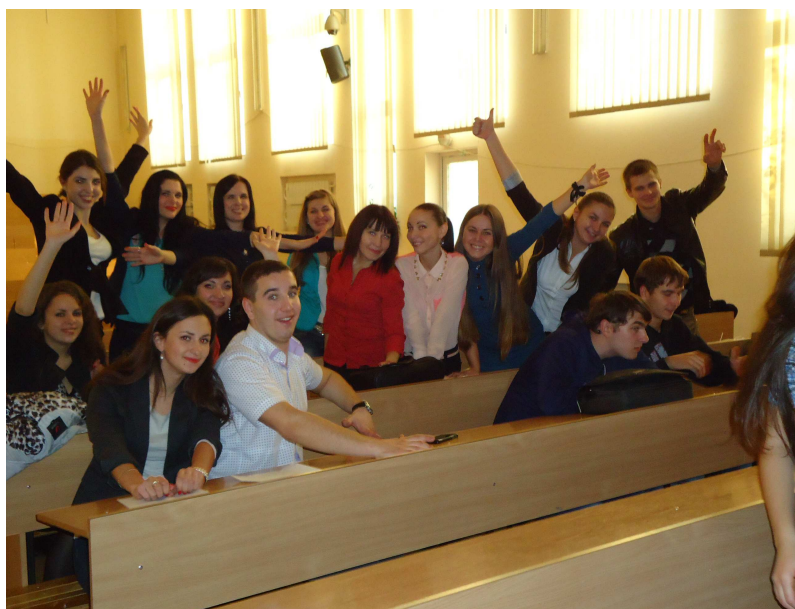
Святкування дня економіста (2013 р.)