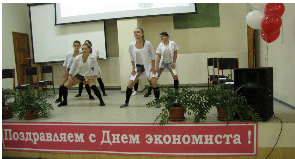
На сцені студенти-першокурсники спеціальності «Економіка підприємства» (2014 р.)