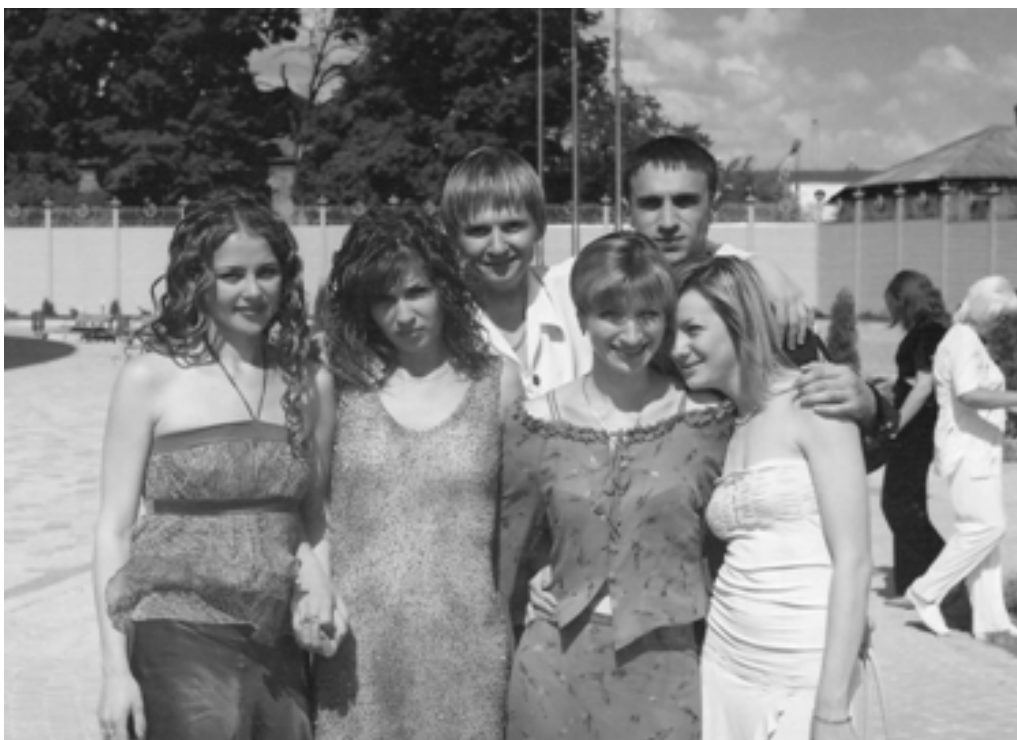
Випускний вечір 2005 р.

Викладацьким складом кафедри постійно підтримуються контакти з випускниками спеціальності «Економіка підприємства» і «Логістика». Доброю традицією вже стало запрошення випускників різних років на святкування Дня економіста.