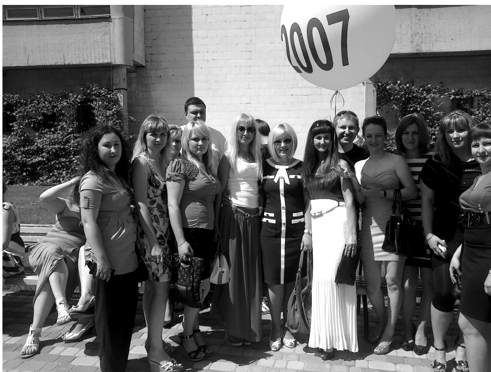
Здрастуй, рідна Alma Mater!

Співробітники кафедри з метою проведення профорієнтаційної роботи регулярно відвідують загальноосвітні заклади м. Харкова, Харківської області та інших регіонів України і в Росії (ЗОШ № 48, 62, 71,