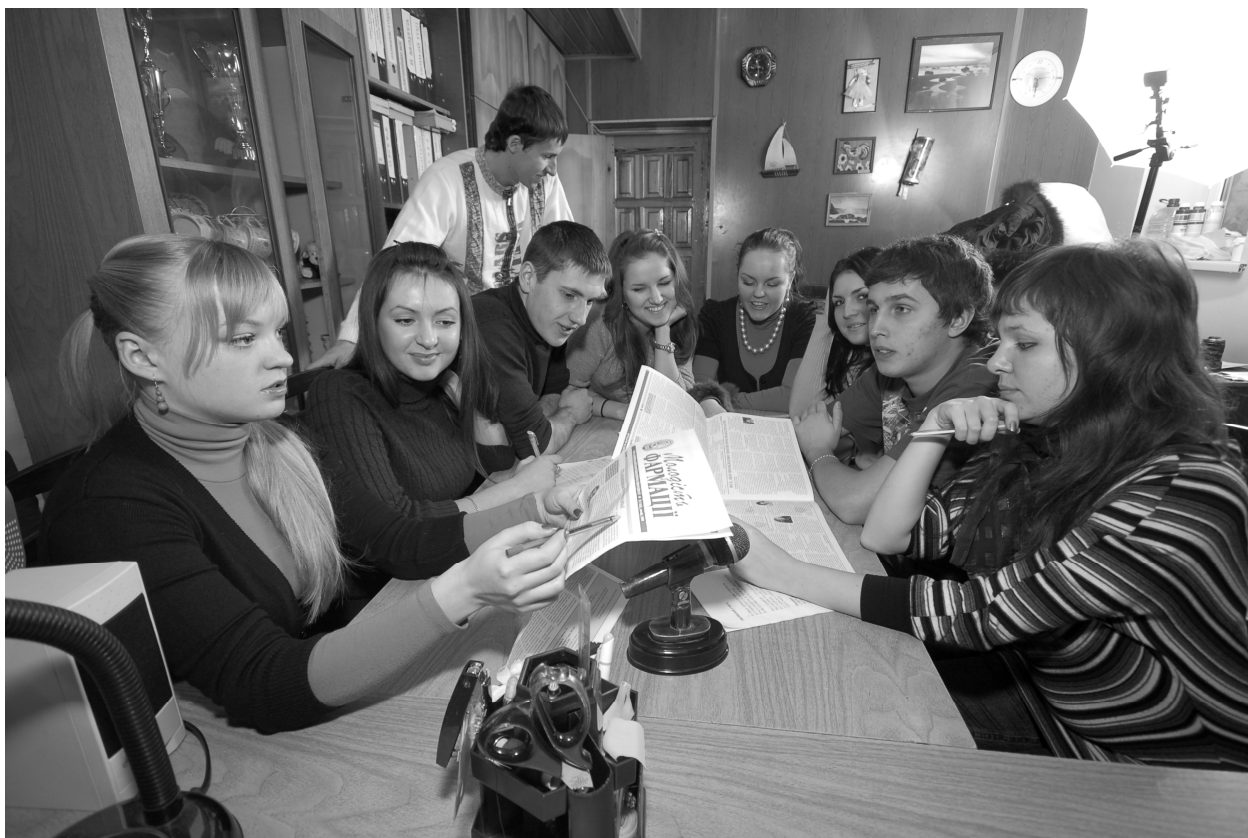
Обговорення актуальних студентських питань