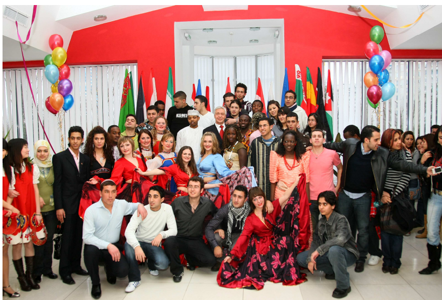
Дружня студентська сім'я НФаУ