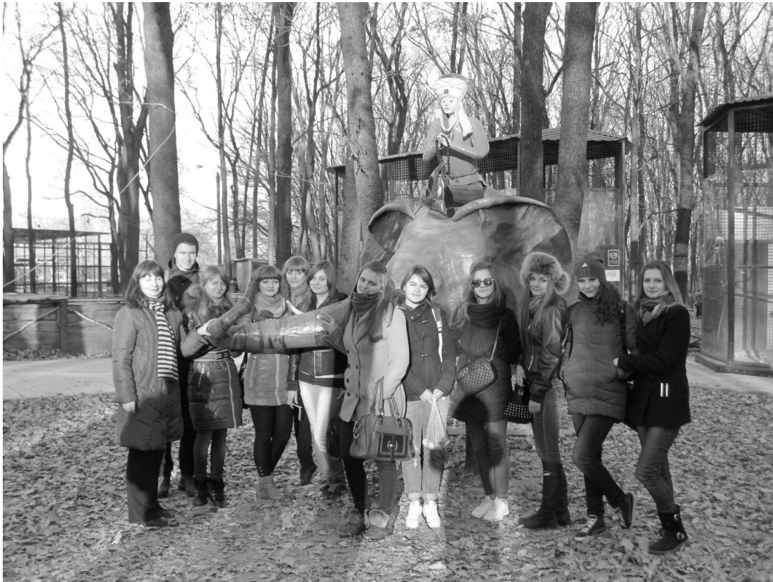
Студенти спеціальностей «Економіка підприємства» і «Маркетинг» на екскурсії в «Екопарку» (2014 р.)

ми ім. О. С. Пушкіна, музею – панорами Полтавської битви (м. Полтава), Feldman Escopark.