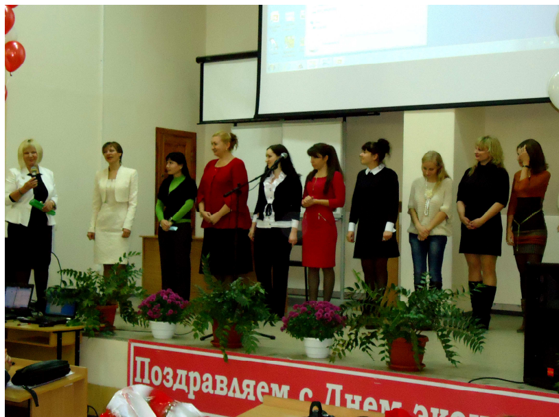
Випускники – на сцену! (2012 р.)