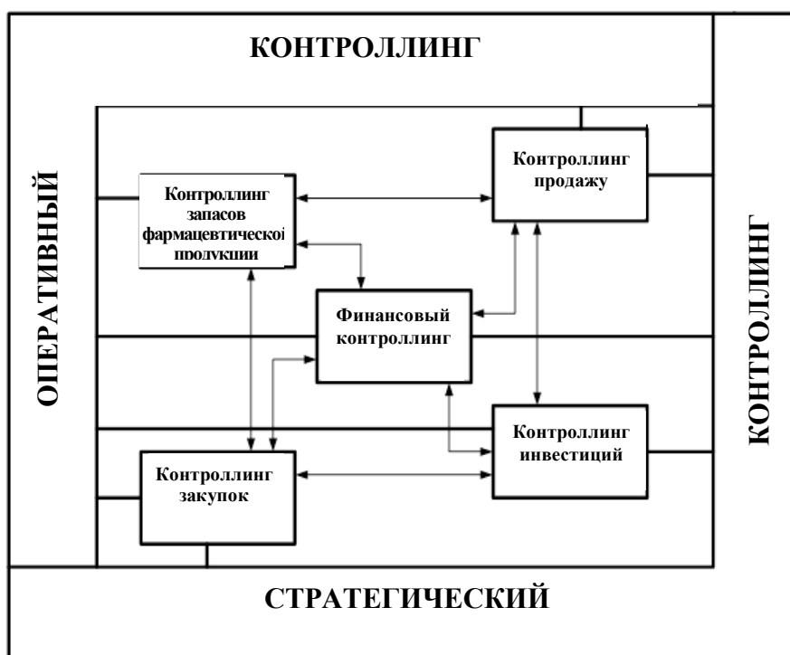
Рис. 1. Место контроллинга запасов в системе управления ОФК

При определении места контроллинга запасов в системе управления оптовым звеном в фармации следует учитывать то, что, как система информационно-аналитической, методической и консультационной поддержки менеджмента, контроллинг должен обеспечить соответствующую поддержку основных направлений управленческой деятельности в компании, которыми являются: планирование, организация и контроль процесса реализации фармацевтической продукции; управления процессами закупок фармацевтической продукции; финансовый менеджмент; управления инвестиционной деятельностью и др. (рис. 1) [1].