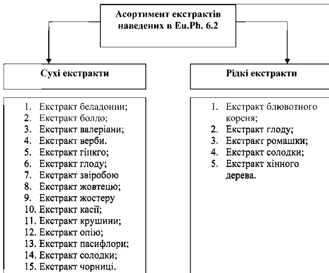
Рис. 1. Асортимент екстрактів наведених в Eu.Ph. 6.2.

макопеї [16, 18] включають загальну статтю на екстракти та містять монографії на окремі екстракти. Так, в Європейській фармакопеї (Eu. Ph. 6.2), наведено 20 монографій на різні види екстрактів (рис. 1) [18].